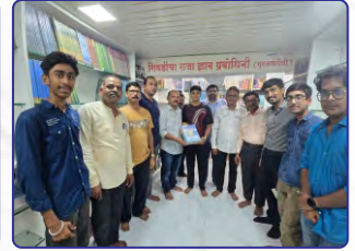
शिवडीचा राजा ज्ञान प्रबोधिनीच्या दहाव्या वर्धापन दिनाचे औचित्य साधून विद्यार्थ्यांना पुस्तके देण्यात आली.