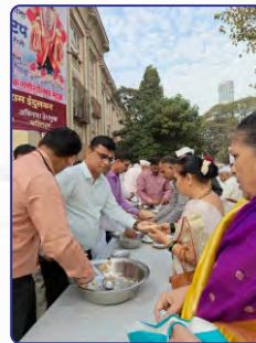
पांडूरंग पालखी सोहळ्यातील वारकऱ्यांना अल्पोपहार वाटप