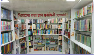
शिवडीचा राजा ज्ञान प्रबोधिनी (पुस्तकपेढी)